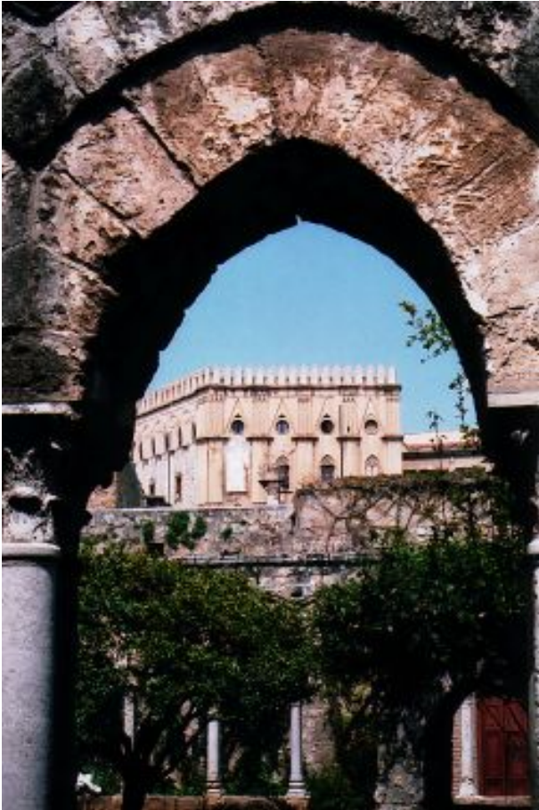
Il Palazzo dei Normanni visto dal chiostro della cappella di San Giovanni degli Eremiti.